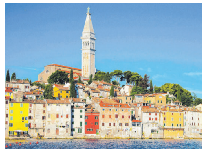
In Istrien finden sich nicht nur schöne Städte wie Rovinj, es ist dort auch besonders günstig für Österreicher.

des bevorstehenden EU-Austritts des Landes nochmals mehr als 2016, weil das Pfund weiter nachgab, 100 Urlaubs-Euro sind dort momentan 113 Euro wert, vor einem Jahr waren es 105. Die teuerste Urlaubsdestination blieb die Schweiz, dort schmelzen 100 Urlaubs-Euros so wie vor einem Jahr auf 62 Euro zusammen. In der Türkei und Ungarn dagegen ist ein mitgebrachter Hunderter 172 bzw. 170 Euro wert.